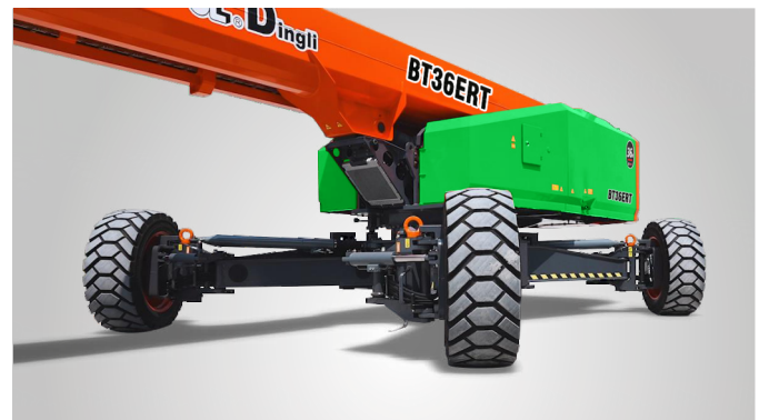
Совершенно новая технология выдвижения мостов одной кнопкой на месте эксплуатации. Глобальная патентная защита