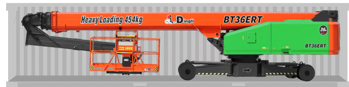
Перевозка в стандартном контейнере