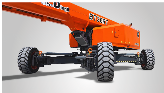
Совершенно новая технология выдвижения мостов одной кнопкой на месте эксплуатации. Глобальная патентная защита