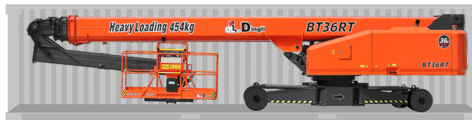
Перевозка в стандартном контейнере