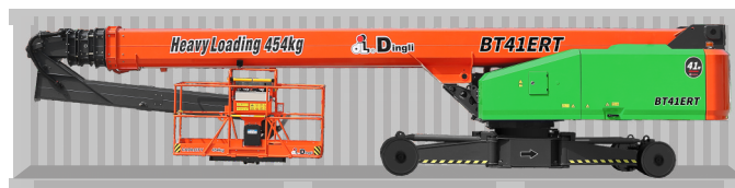
Перевозка в стандартном контейнере