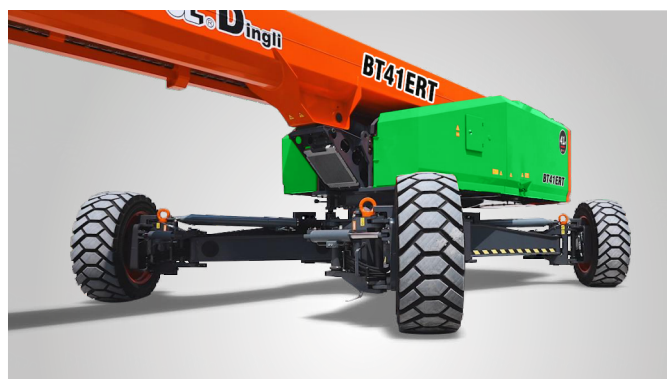
Совершенно новая технология выдвижения мостов одной кнопкой на месте эксплуатации. Глобальная патентная защита