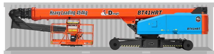
Перевозка в стандартном контейнере