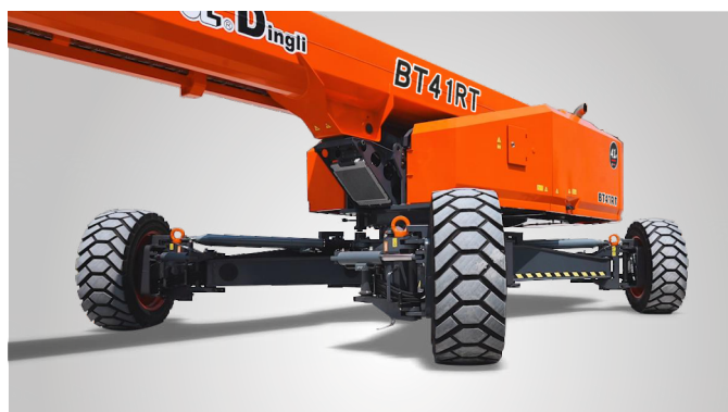
Совершенно новая технология выдвижения мостов одной кнопкой на месте эксплуатации. Глобальная патентная защита