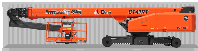
Перевозка в стандартном контейнере