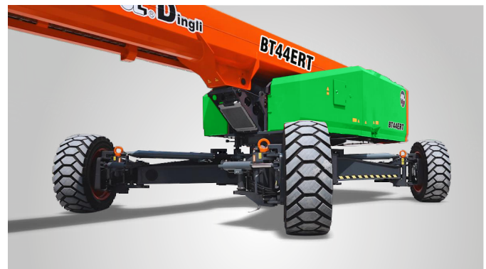
Совершенно новая технология выдвижения мостов одной кнопкой на месте эксплуатации. Глобальная патентная защита