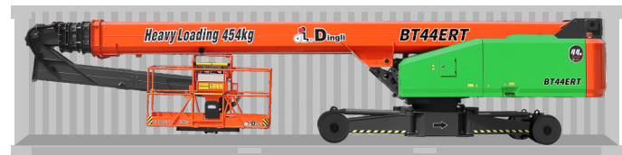
Перевозка в стандартном контейнере