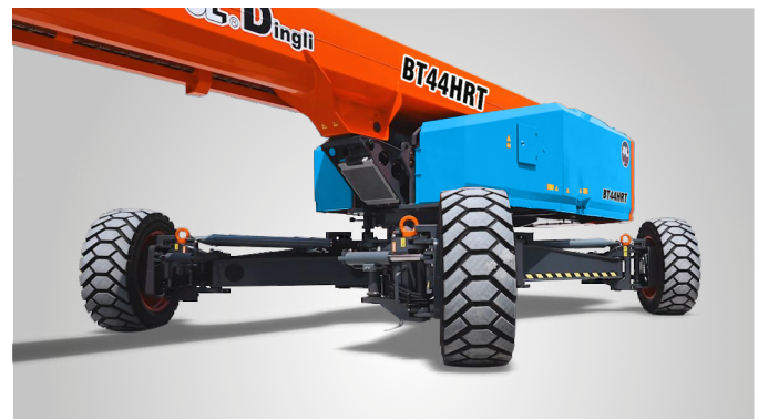
Совершенно новая технология выдвижения мостов одной кнопкой на месте эксплуатации. Глобальная патентная защита